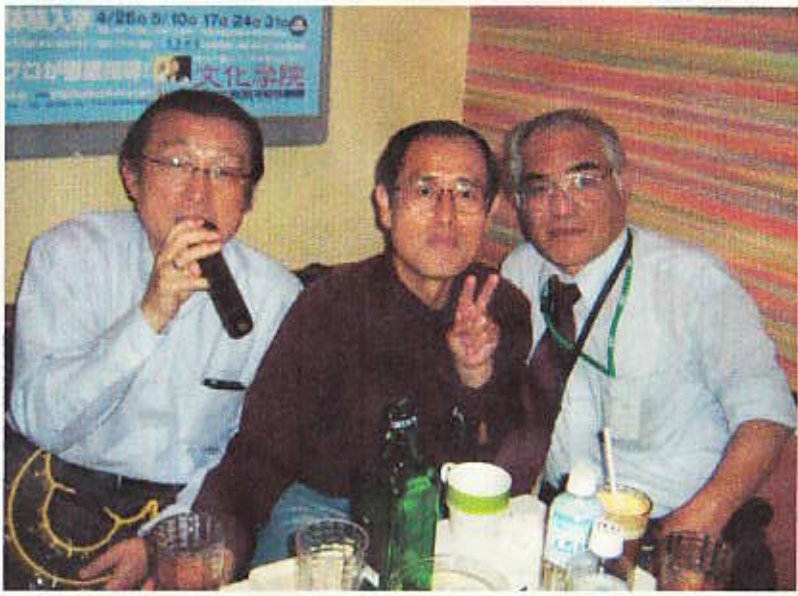
いつものごとくさくら水産⇒歌広のコースで、おじさん4人で盛り上がりました。